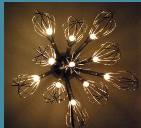
Šňahače, dizajn Adriana Debnárová, VŠVU Bratislava

Slovenské centrum dizajnu usporiada v spolupráci s Vysokou školou výtvarných umení výstavu Fórum dizajnu 2009 ako súčasť medzinárodného veľtrhu Nábytok a bývanie 2009 v Nitre. Podujatie sa koná od 10. – 15. marca 2009 v pavilóne M3 pod názvom Svetlo proti tme.