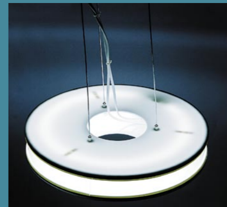
Svietidlo, dizajn Eva Pavelová, STU Bratislava